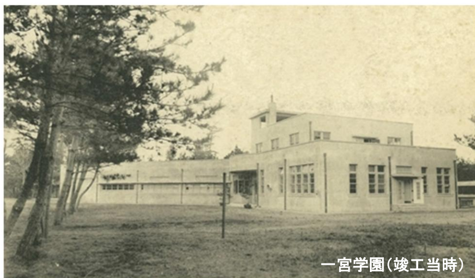
一宮学園(竣工当時)

上記の他、定款に定められた議決事項及び重要な事項を審議するため、適宜評議員会を開催する。